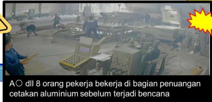
A○ dll 8 orang pekerja bekerja di bagian penuangan cetakan aluminium sebelum terjadi bencana