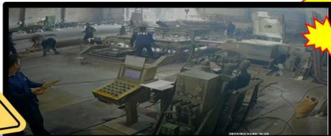
Hình ảnh làm việc của các công nhân đúc nhôm trước khi xảy ra tai nạn