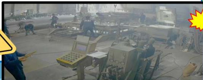
災害發生前阿○等8名勞工從事鋁模澆注作業