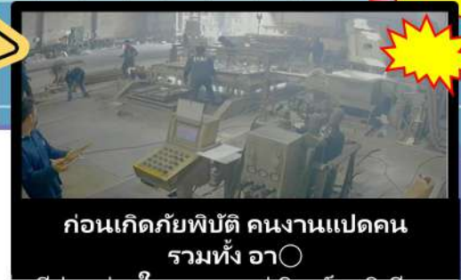
ก่อนเกิดภัยพิบัติ คนงานแปดคน รวมทั้ง อา○

สำหรับการป้องกันการไหม้หรืออันตรายอื่นๆ ที่เกิดจากการกระเจิงหรือการรั่วไหลของวัสดุในสถานที่ทำงาน ที่จัดการวัสดุมีความร้อนสูง นายจ้างไม่ได้ใช้มาตรการวิธีการป้องกันที่เหมาะสม (อุปกรณ์เชื่อมโยงที่มีความปลอดภัย ติดตั้งอุปกรณ์ตรวจสอบ อุปกรณ์แก้ไขในยามฉุกเฉินและการควบคุมจำนวนคนอย่างเข้มงวดและการควบคุมความแห้ง ฯลฯ ) และไม่บังคับแรงงานต้องสวมอุปกรณ์ป้องกันที่เหมาะสม