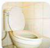
Pagkatapos Gumamit Ng Banyo