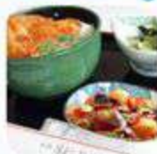
ก่อนรับประทานอาหาร

ข้อบ่งชี้ในการล้าง มือของบุคคล โดยทั่วไป