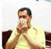
Pagkatapos Suminga, Umubo At Bumahing