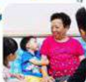
Bago At Pagkatapos Humawak Sa Pasyente