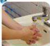
Làm ướt tay