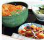
Trước khi ăn