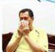
擤鼻涕、咳嗽 或打噴嚏後