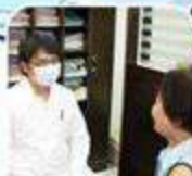
Sau khi khám bệnh.....