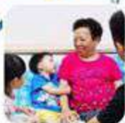
Sebelum dan setelah melakukan kontak fisik dengan orang sakit