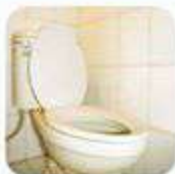
Setelah menggunakan kamar mandi/WC