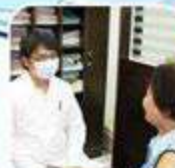
Pagkatapos Komunsulta Sa Doktor ...At Iba Pa