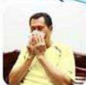
Setelah membersihkan ingus, batuk, atau bersin