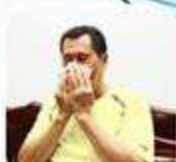
Sau khi hỉ mũi, ho, hoặc hắt hơi