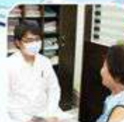
หลังจากตรวจโรค เป็นต้น