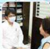
Setelah lihat dokter