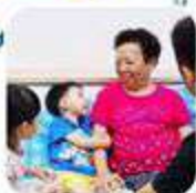
ก่อนและหลังสัมผัสผู้ป่วย