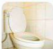
Sau khi đi vệ sinh