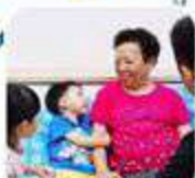
Trước và sau khi tiếp xúc với người bệnh