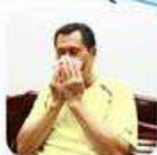
หลังเช็ดน้ำมูก โห หรือจาม